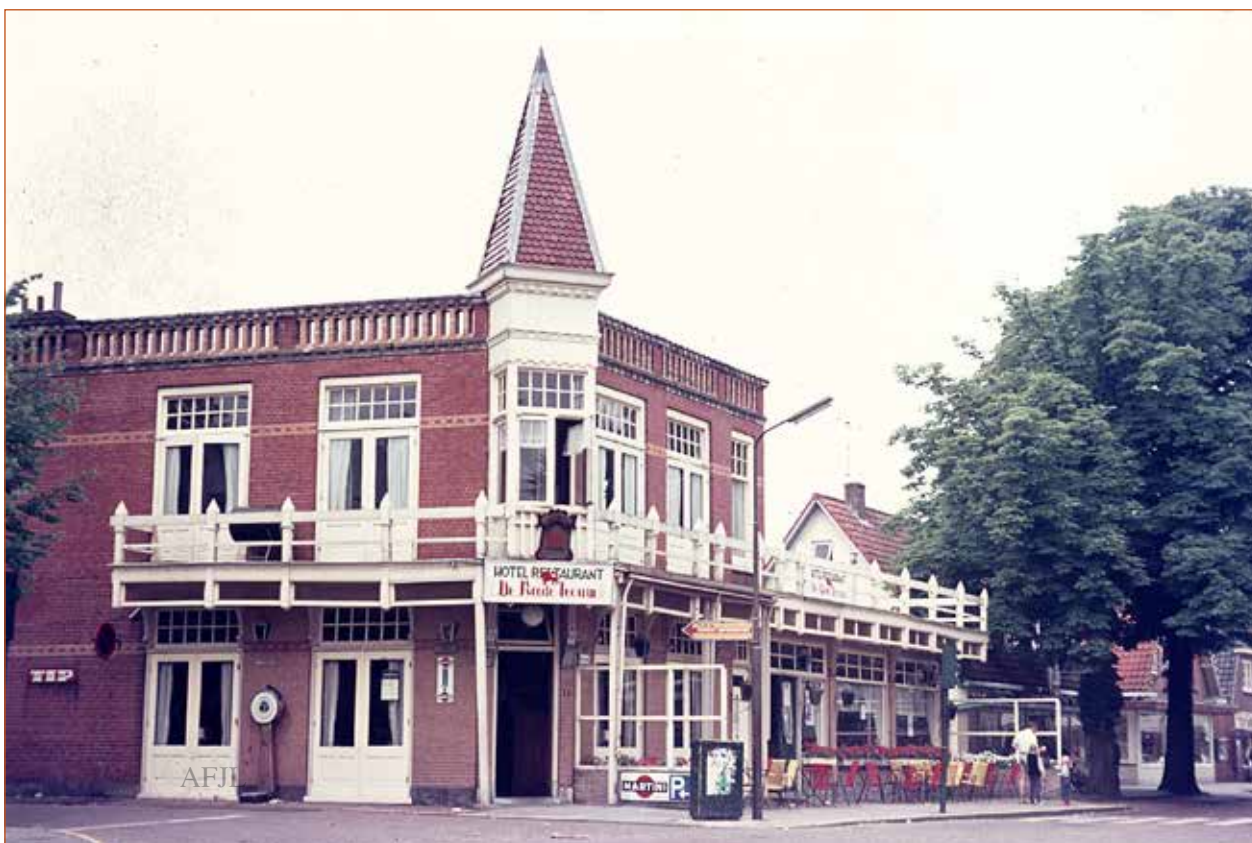
De Rode Leeuw omstreek 1970