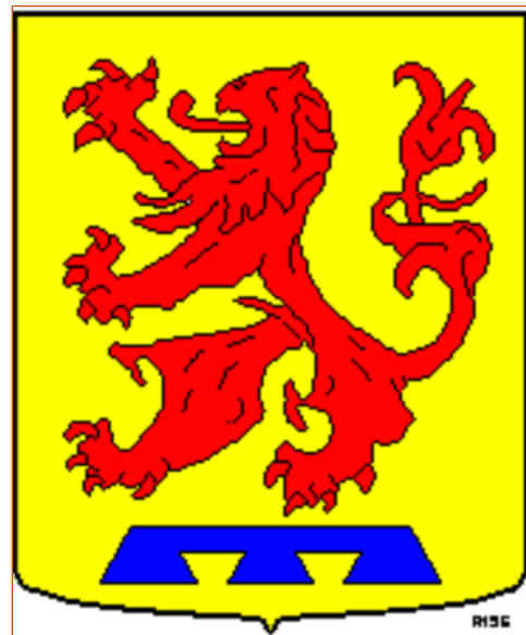
Het wapen van Groet met drie pendants.