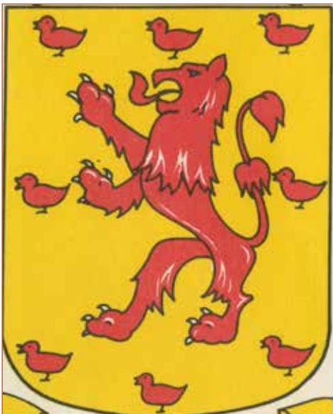
Het wapen van Schoorl met acht merletten.

Binnen de sectie Schoorl vinden we de buurtschappen; Schoorl Centrum, Buitenduin, Schoorldam en Brechtdorp. Binnen de sectie Groet liggen Groet en Zijpersluis en binnen de sectie Hargen liggen de buurtschappen Hargen en Camperduin.