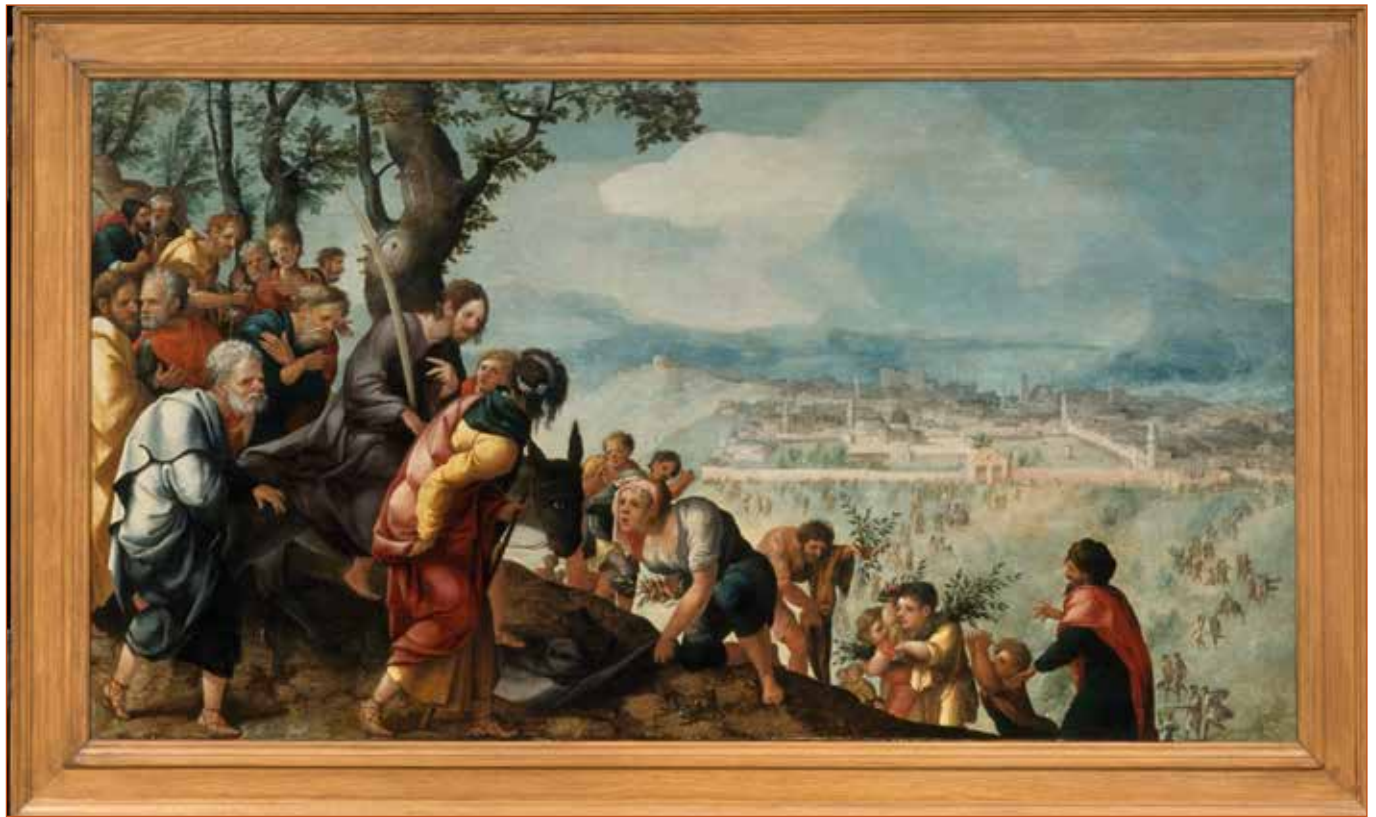
Het middengedeelte van het zgn. 'Lochorts-drieluik' werd omstreeks 1527 door Jan van Scorel geschilderd. Uitgebeeld is het bijbelse verhaal 'De intocht in Jeruzalem'. (collectie Centraal Museum Utrecht)