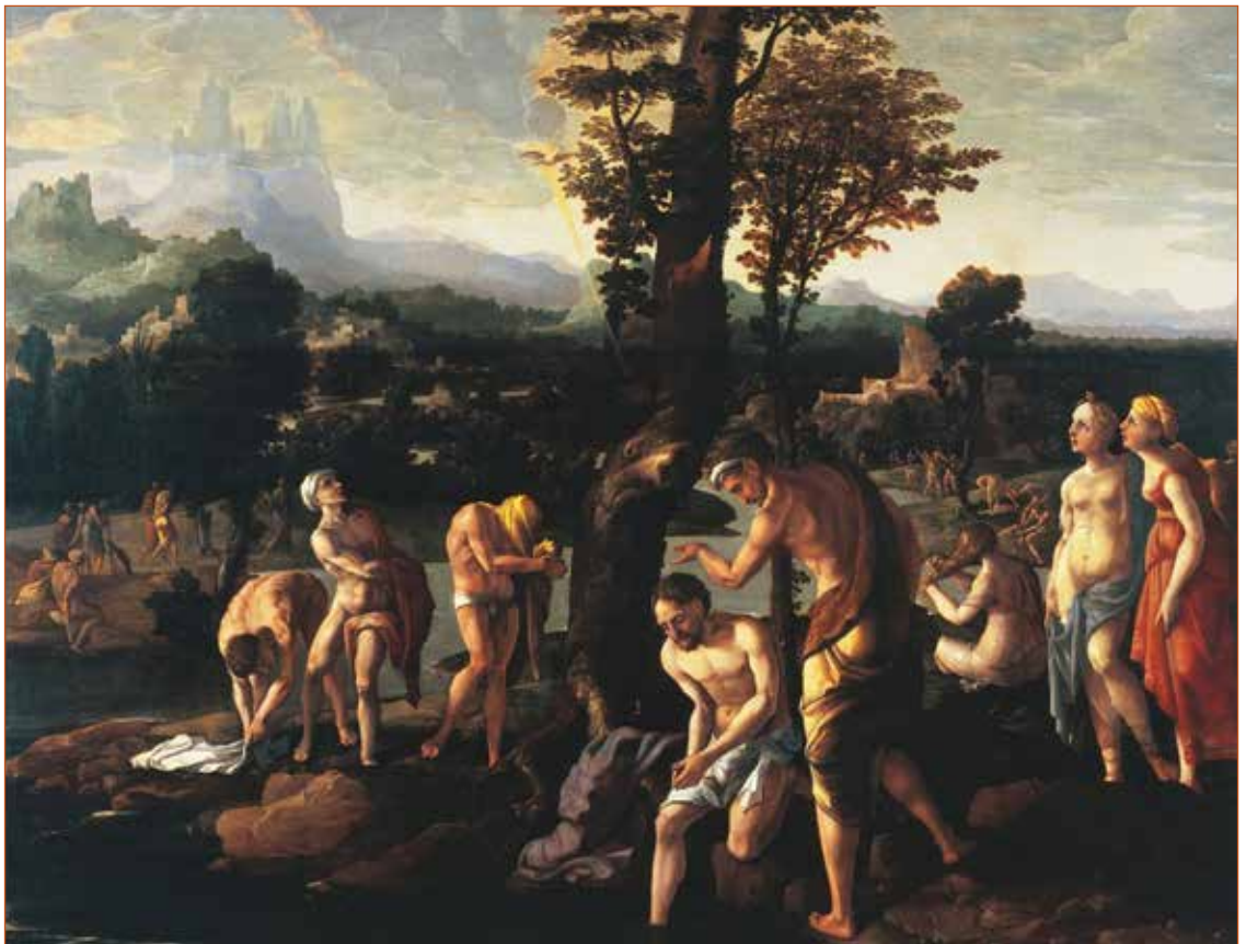
Doop van Christus, Jan van Scorel, geschilderd tussen 1527 en 1530.

Jan van Scorel was allereerst schilder en tekenaar. Van zijn werken zijn er een aantal te zien in ons land, in Amsterdam, Utrecht, Haarlem, Rotterdam en Breda. Veel meer van zijn werk bevindt zich in het buitenland, in Spanje vooral, maar verder in nagenoeg alle grote musea ter wereld. Want museumdirecteuren en kenners willen graag één der voortbrengselen van zijn hand in hun bezit hebben, omdat hij een sleutelfiguur is in de ontwikkeling van de schilderkunst.