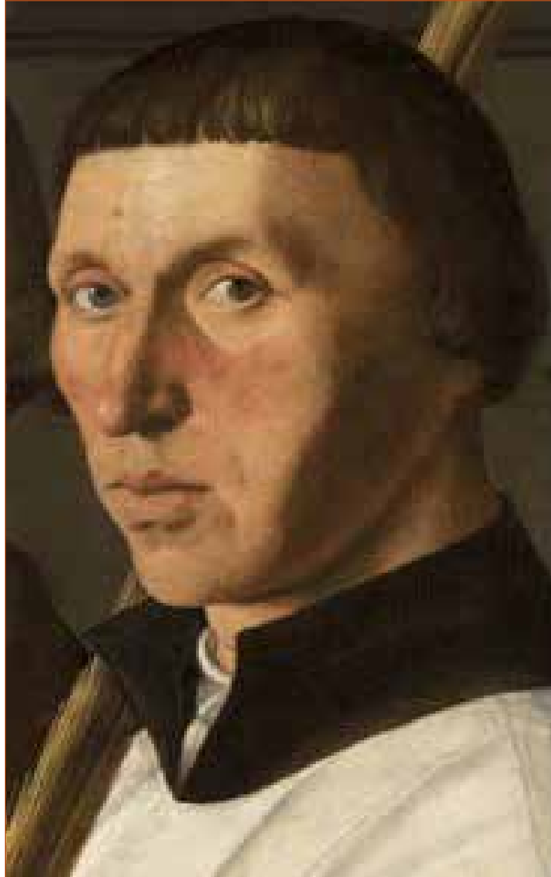
Detail Jeruzalemvaarders (collectie Frans Halsmuseum, Haarlem)

De oorspronkelijke illustraties zijn deels vervangen en aangevuld door kleurafbeeldingen.