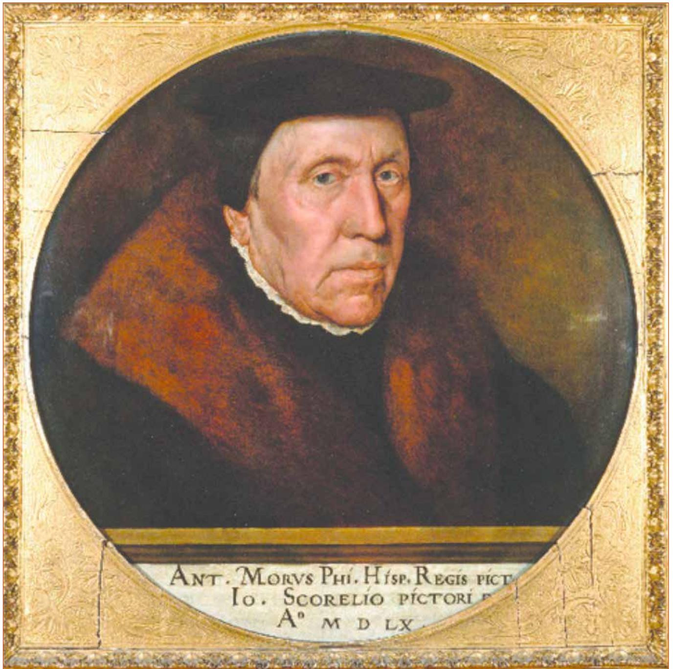
Een schitterend portret van de oudere Jan van Scorel - hij is hier 64 jaar - geschilderd door Anthonie Mor, één van Van Scorels begaafde leerlingen. Jan van Scorel overleed op 67-jarige leeftijd in 1562 te Utrecht.