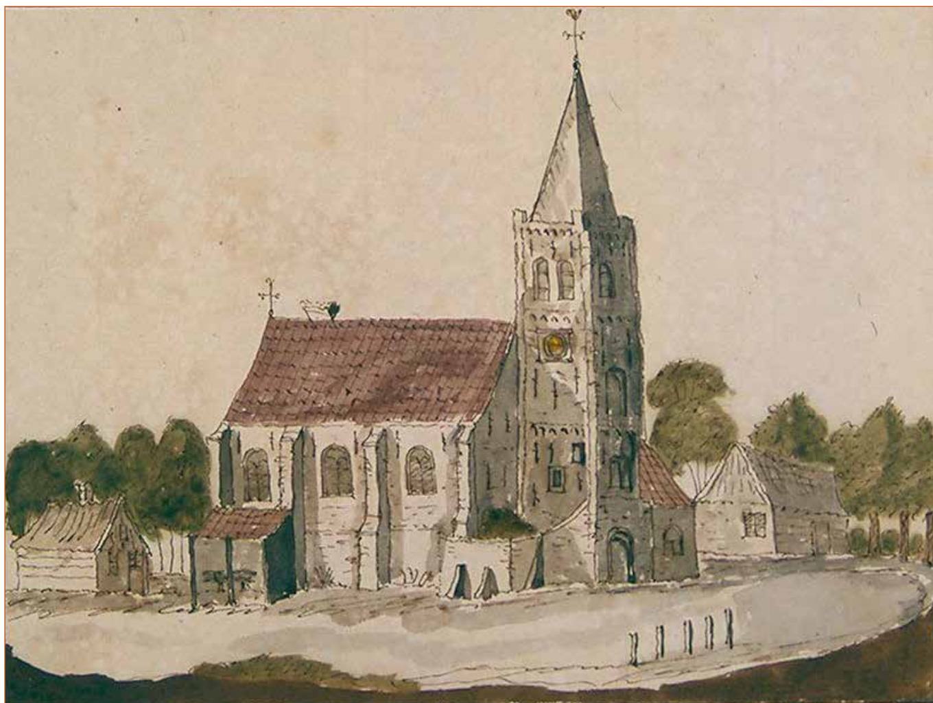
In het jaar 1729 maakte de bekende tekenaar J. Stellingwerf deze afbeelding van de oude Schoorlse dorpskerk. In 1779 zou de toren plotseling instorten, de gehele kerk in zijn val vernielend. In 1783 ontstond een nieuwe kerk, die nog steeds op dezelfde plek te vinden is.