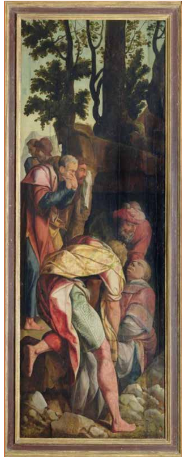
'De graflegging van Stefanus', zijpaneel van het in 1540 door Jan van Scorel geschilderde 'Jacobus-en Stefanusaltaarstuk. (collectie Musée de la Chartreuse, Douai)

Dit zeer bekende portret van een twaalfjarige jongen, een scholier, werd door Jan van Scorel in 1513 op hout geschilderd. (collectie Museum Boymans-van Beuningen, Rotterdam), pag. 8.