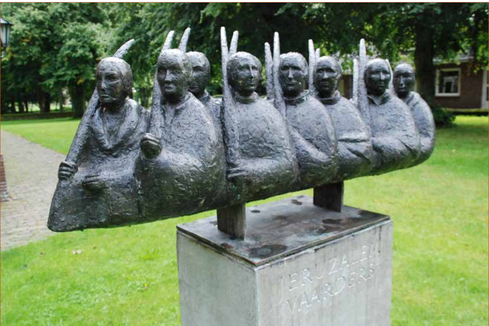
Het beeld van de Jeruzalemvaarders door Ellen de Groot.