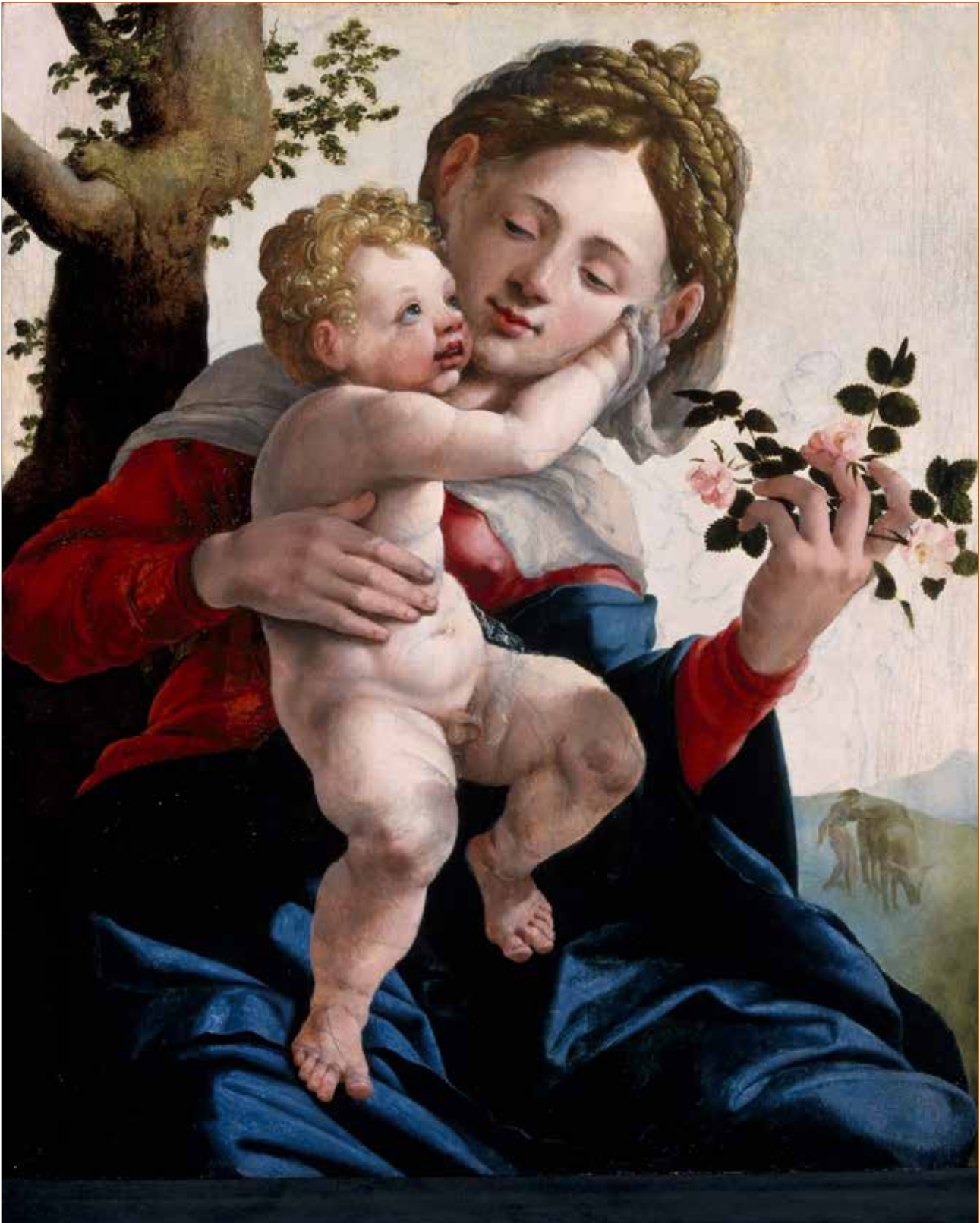
Tot de religieuze werken van Jan van Scorel behoort ook deze, tussen 1530 en 1540 geschilderde Madonna. De ondergrond van dit lieflijke schilderij is van hout. (collectie Centraal Museum Utrecht)