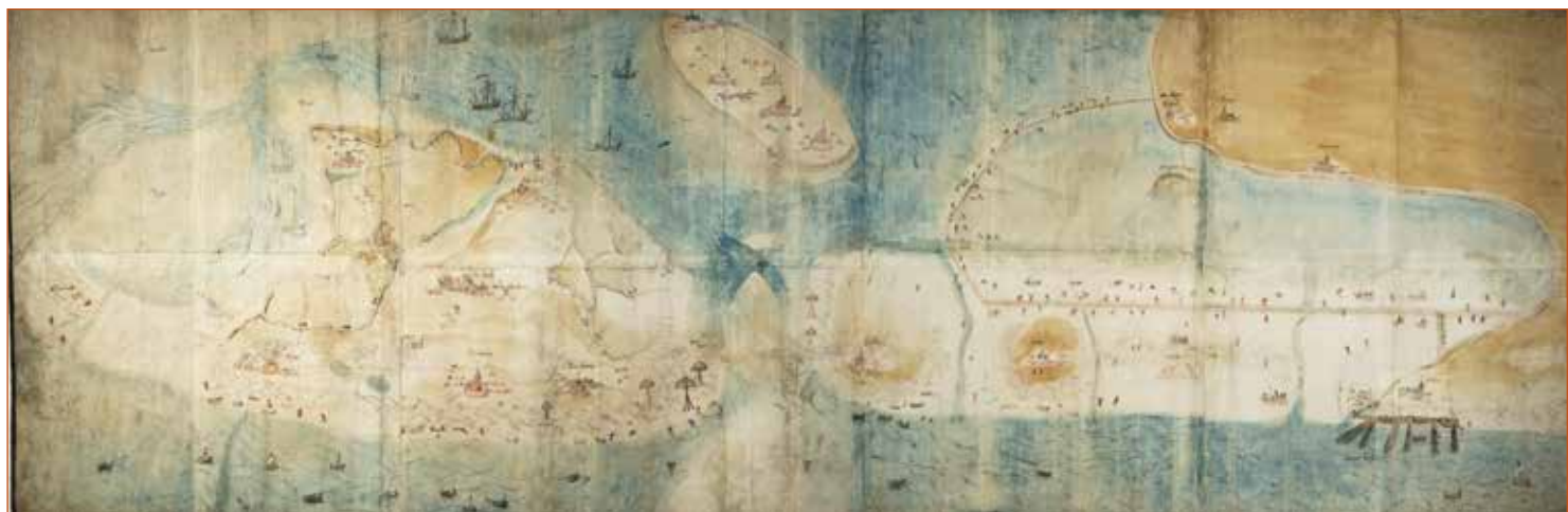
Met de hand getekende en ingekleurde kaart van Texel, Wieringen en de Zijpe in zijn eerste bedijking. Aan Jan van Scorel toegeschreven, 1522 of 1553.

De droogmaking van de Zijpe verliep niet zo voorspoedig als verwacht mocht worden. Maar de Zijpe is toch - in 1597 - volgens de plannen drooggemaakt. De twee uitvindingen van Jan van Scorel hebben een reusachtige invloed op de waterstaatkundige toestand van ons land gehad.