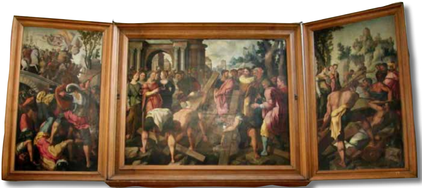
Drieluik 'De kruisvinding' in de Grote Kerk van Breda.

'St. Stefanus en St. Jacob', weer teruggevonden. Het werd, compleet op één paneel na, in 1977 te Utrecht tentoongesteld. Oorspronkelijk was het bestemd voor een kerk in Marchiennes (Noord-Frankrijk).