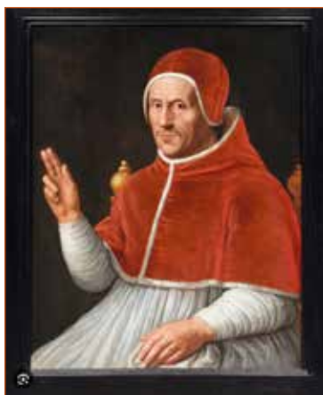
Paus Adrianus VI (Nederlandse paus) door Jan van Scorel.