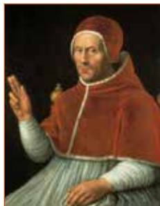
De Nederlandse paus Adrianus VI.

Jan van Scorel spoedde zich naar Rome. Daar werd hij beheerder van de kunstschaten van het Vaticaan, als opvolger van Raphaël Sanzi d'Urbino, die kort te voren overleden was. De taak waarvoor paus Adrianus VI zich gesteld zag, was onmogelijk zwaar. De Europese staten beoorloogden elkaar, de Turkse legers drongen steeds verder de Balkan binnen, de katholieke kerk stond door de nieuwe inzichten van Maarten Luther aan heftige kritiek bloot. Paus Adrianus VI, een geleerd, wijs en sober man, heeft de strijd op die vele fronten nauwelijks twee jaar kunnen volhouden. Hij stierf als vreemdeling in een vijandige stad.