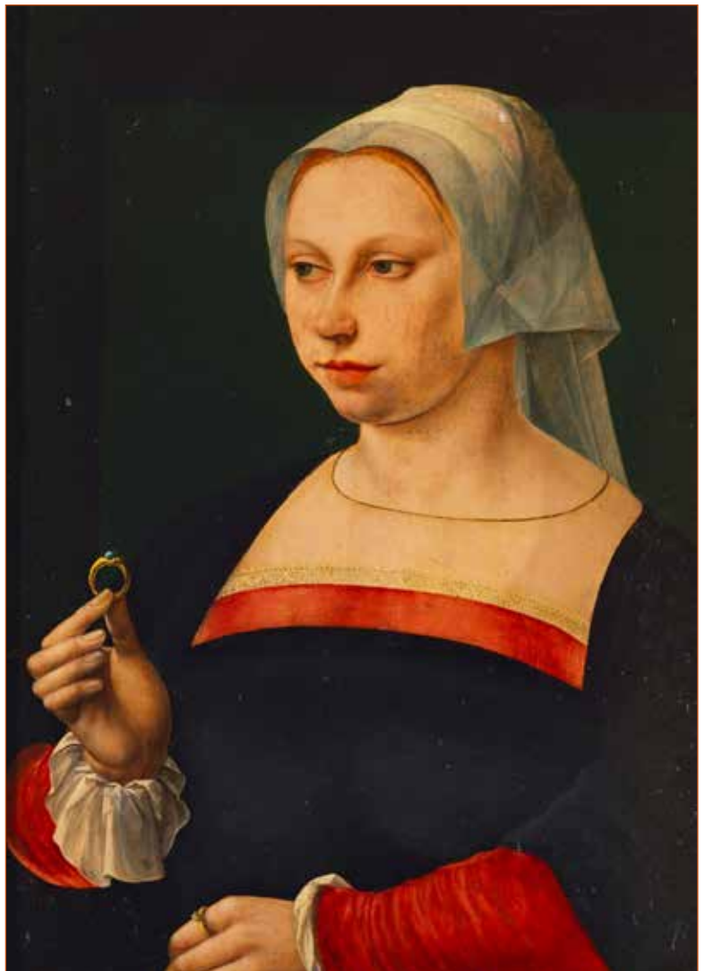
Portret van dame met ring door Jan van Scorel . (privé collectie)