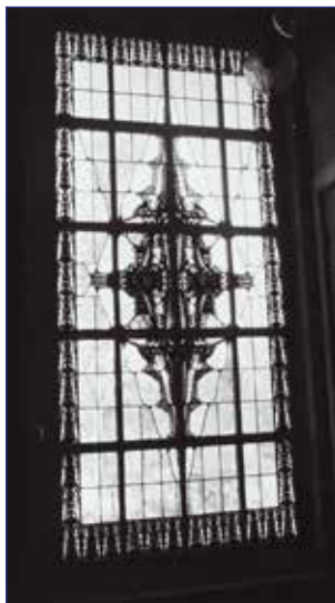
uit 'Schoorl in architectuur' (uitgeverij Pirola 1984)