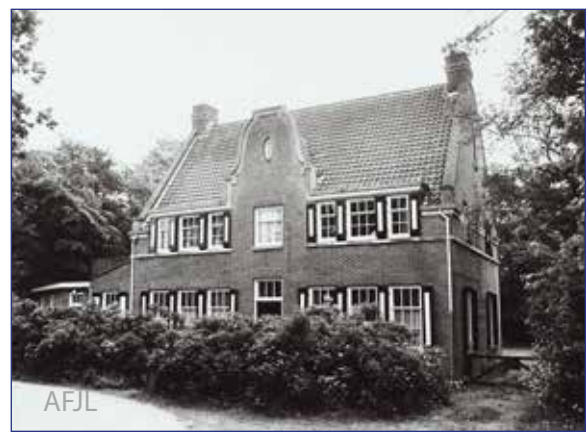
uit 'Schoorl in architectuur' (uitgeverij Pirola 1984)