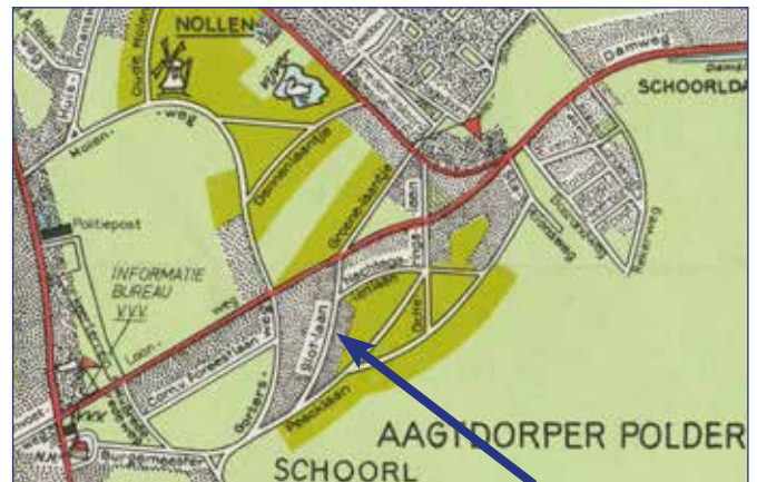
detail V.V.V. kaart

De Slotlaan, zoals getekend op het plan van 1911 werd nooit zo gerealiseerd. Pas in 1925 werd de Slotlaan, zoals hij nu is, gerealiseerd.